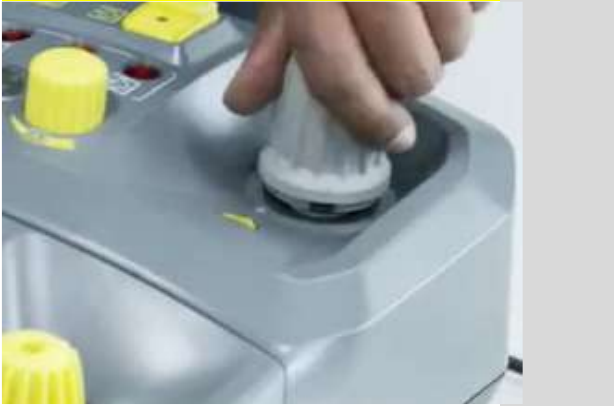
5 Draai de grijze dop stevig vast