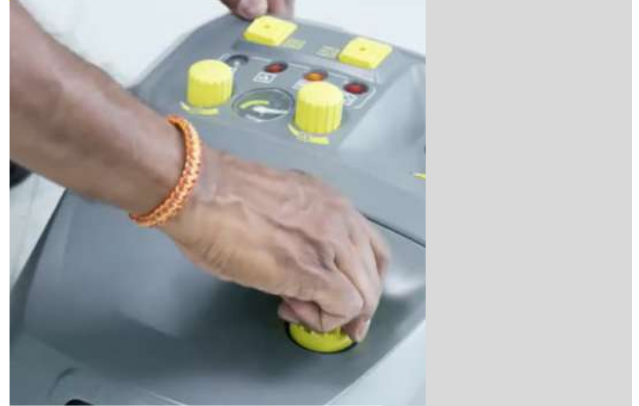
6 Draai de gele dop los