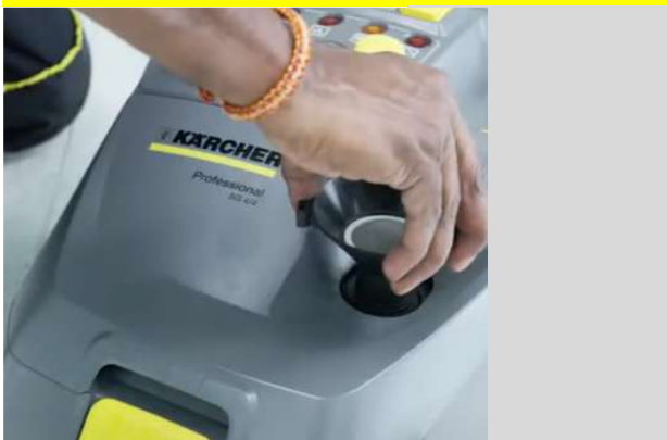
7 Plaats hier de trechter en draai vast