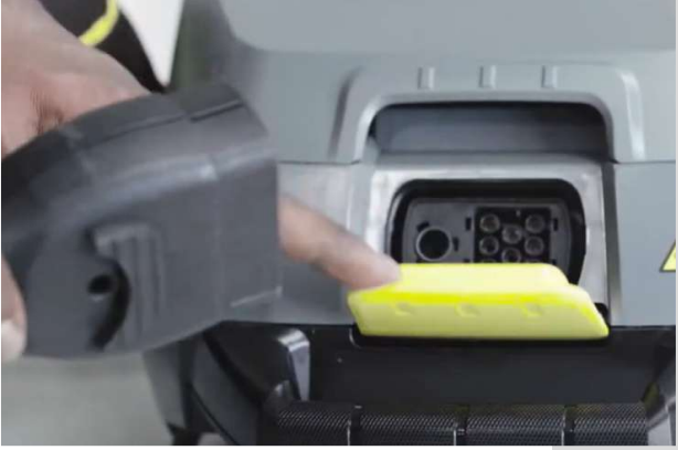
1 Open gele klep en sluit stoomslang aan