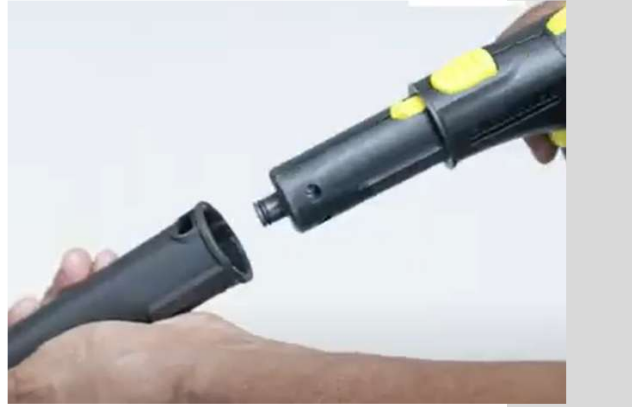
2 Klik de toebehoren vast op het pistool