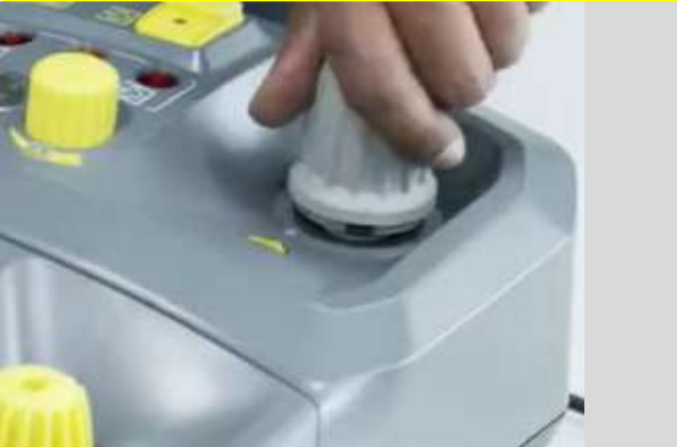
3 Draai de grijze dop los